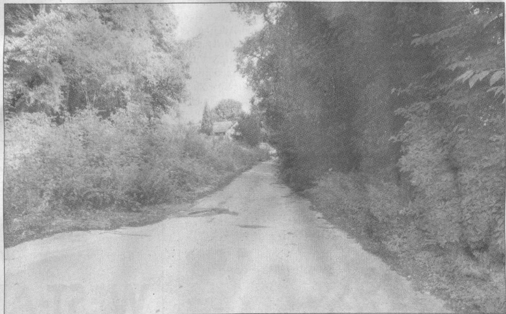
Dieser befestigte Weg ist der einzige, der derzeit zum Baugebiet führt. Er wurde für die Abräumung von Kohlehalden erstellt und reicht nicht aus, um den geplanten Rhader Hof zu erschließen. Dadurch befürchten die Anwohner große Unruhe.